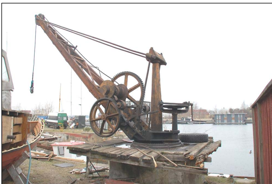
Her ses kranen, som er ved at blive flyttet fra sit fundament i Københavns Havn.

Oplysninger om Otto Bruuns fond kan findes på www.ottobruunsfond.dk .